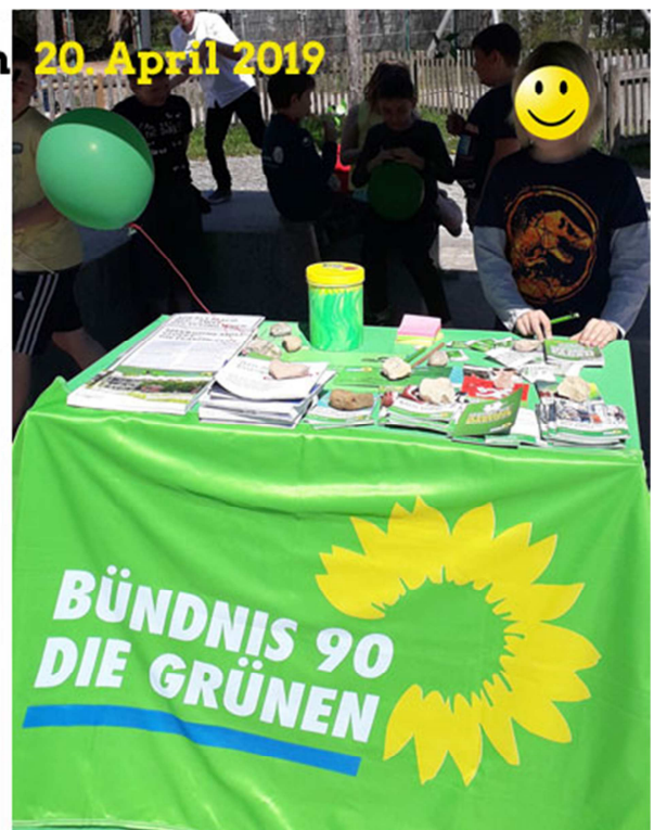
Abb.: Kleine Sammlung von Themen, die Kindern auf den Herzen liegen.

mehr Süßigkeiten (3x) Mehr zocken, PS4 (3x) Ein Nintendo Trampolin Schminke Mehr Pokestops in Donau von Pokemon Fernsehen