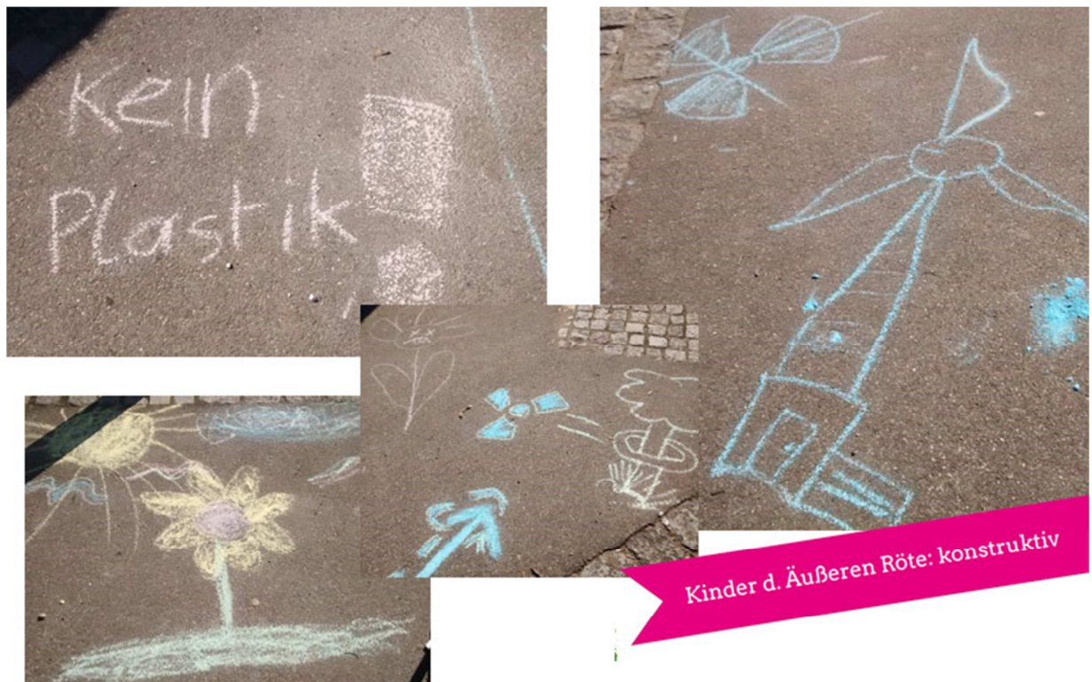
Abb.: Ein Kind brachte Straßenkreide, die gerne genutzt wurde.